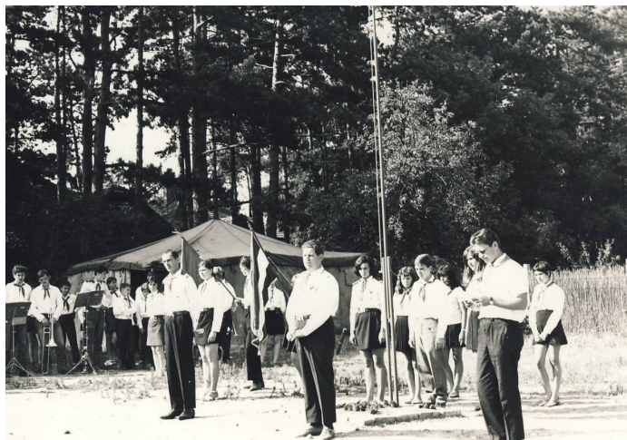
Zászlólevonás a balatonfenyvesi táborban.

Balatonfenyvesen a tábor telkének utca felé eső részére tíz faházat telepítettek, amelyekben a KISZ bizottságok alkalmazottjai üdülhettek családjukkal a nyári hónapokban. Étkezésüket térítés ellenében a mindenkori tábor biztosította. Ez jól működött egészen addig, amíg a megyei úttörőtábor létezett.