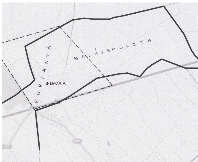
A kurjantói iskola vonzókörzete

Az iskola vonzókörzetének ez az idő tájt kb. 400–450 lakosa volt. Ide tartozott egész Kurjantó, Balázspuszta egy része, Szabadszállás Oldalkosárnak hívott része, de néha Izsák gedeondúli és Kisizsák részéből is jártak hozzánk tanulók. (Ez néha azért is bekövetkezett, mert a szülők valami miatt nézeteltérésbe keveredtek az ottani tanítóval, leginkább azért, mert megbukott a gyerek, hát szerencsét próbáltak a másik közeli iskolával.) Ez a mozgás az ellenkező irányban is működött.