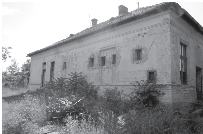
Az iskola épülete és az összedőlt szövetkezeti bolt 2014-ben