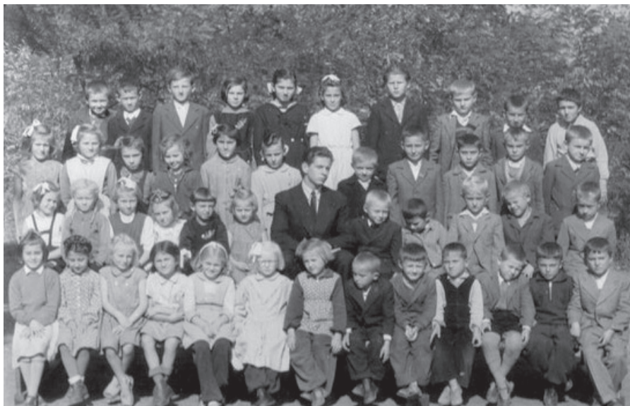
Az első tanulócsoportom

Legnagyobb sikeremnek azt tartottam, hogy az osztatlan osztályom tanulói olvasni, írni, fogalmazni, számolni nem tudtak kevésbé, mint a községi iskola osztott osztályaiban tanuló hasonló osztályba járó gyerekek. Ezekben a tudásszintjük nem volt „tanyai”. Sportversenyeken talán, rajzpályázatokon biztosan lemaradtak volna. Magatartásban, szorgalomban és tisztességben biztosan nem maradtak el a községi és a városi gyerekektől, sőt, az utóbbiak közül többen talán példát vehettek volna az én tanyai kis tanítványaimtól.