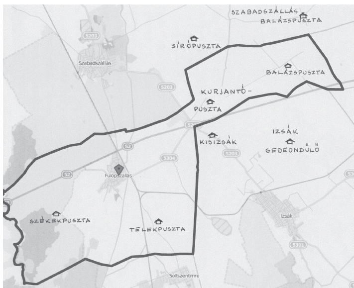
Fülöpszállás térképe a tanyai iskolákkal

Kurjantó a Duna-Tisza-közi homokhátság részeként homokos talajú területe a községnek, szemben a többi résszel, amelyeket szikes legelők urálnak. Kurjantó-