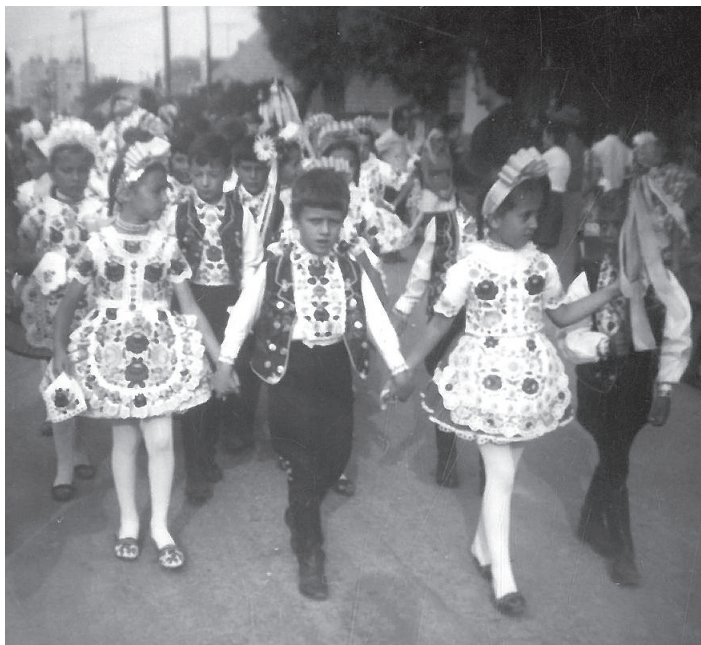
A kalocsai táncscsoport az úttörő néptáncfesztivál felvonulásán

A rendezvénnyel az Országos Úttörő Elnökség olyan mértékben volt elégedett, hogy ősszel engem Úttörővezető Érdemérem kitüntetésben részesítettek, amivel még pénzjutalom is járt.