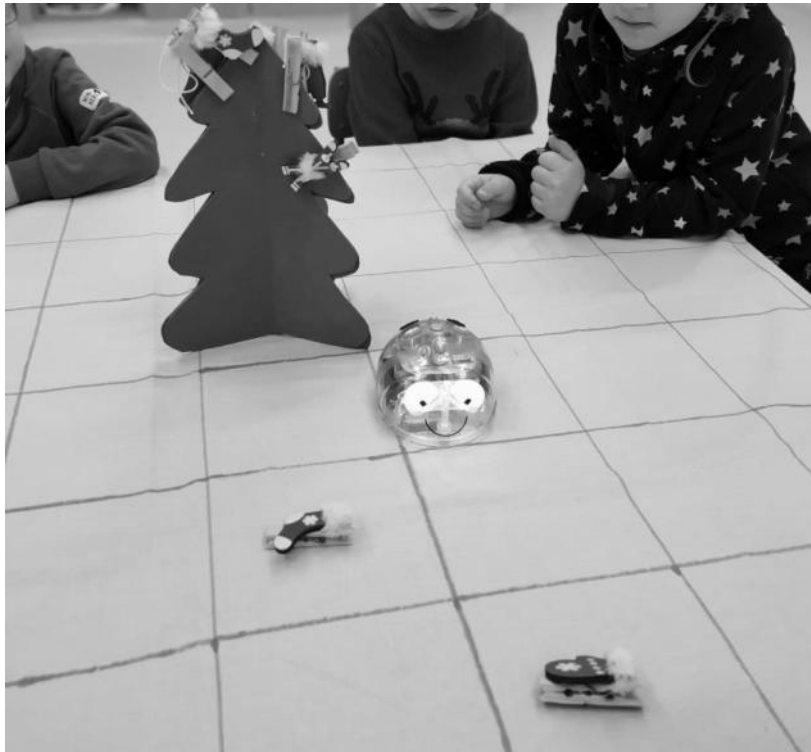
Karácsonyfa díszítés Blue Bottal