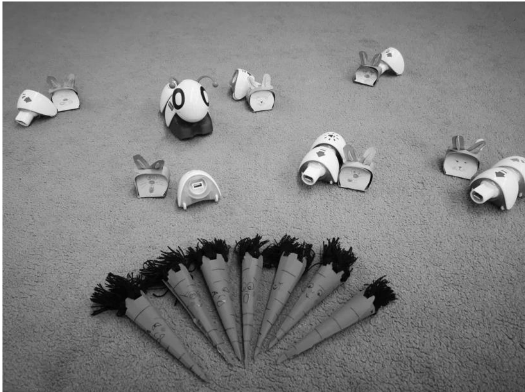
Húsvéti „ézelmes répák”- játék Code-a-pillar robottal

Felhasználási területek éppen ezért sokfélék: legfontosabb, hogy a bármely szempontból az átlagostól eltérő SNI, BTMN-es gyermekek számára kiváló fejlesztő eszköz, ahol, nem csak az egyéni képességek, de a szociális kompetenciák is bővíthetnek, hiszen különböző páros, vagy mikrocsoportos feladatmegoldások során megtanulnak kapcsolatot teremteni másokkal, így még barátságok is kialakulnak. Illetve folyamatos motivációt ad számukra, mindig van kedvük a robottal játszani, így azonnal a tevékenység aktív részeseivé válnak.