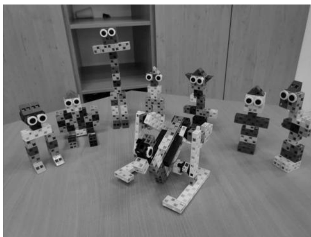
A Rege a csodaszarvasról legenda feldolgozása ArTeC robotok segítségével

Megjelenhet óvodai csoportban rendszeresen, a mindennapi fejlesztő foglalkozásokba ágyazva, különböző témákhoz, gyermekek képességeihez, érdeklődéséhez igazítva differenciáltan. A képeken Vincent Van Gogh: Éjjeli kávézó festményfeldolgozó projekthét eredményei láthatók. A gyerekek megépítették a teaházat, először kartonból, Edisonval szállították. Matematika foglalkozás keretében különböző színű és méretű széket rendezhettek sorba, előre megadott szabályok alapján egy társasjátékban, ahol a bábu Ozobot bit volt. ArTeC robotok segítségével forgó és programozható teaházat alkottak. Cél az egészségvédő szemléletmód megalapozása, digitális kompetencia fejlesztése volt. Gyógyteákkal ismerkedtek, melyeket meg is kóstoltak.