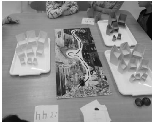
Matematikai tevékenység Ozobot Bit robottal