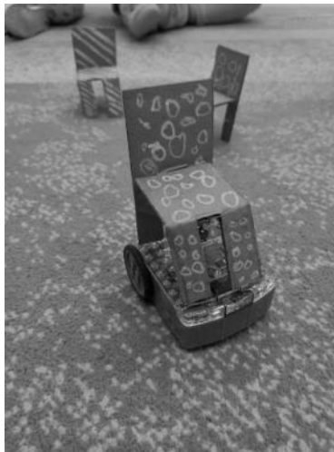
Edison a szállító