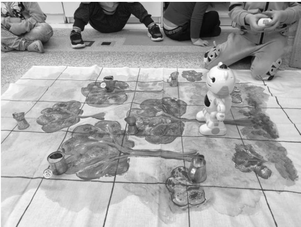
Újrapapír világnapjára készült játék, locsolók aljára rejtetett különböző fajta papírok megkeresése volt a feladat Blip robot segítségével, klasszikus tapintó párosító játék robotos változata