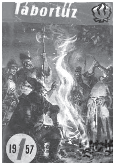
Az első szám címlapja

köré, aminek eredményeként 1957 februárjában megjelent a Tábortűz első száma. Az Ifjúsági Lapkiadó Vállalat adta ki, 21×14 cm-es formátumban, 32 oldalon, színes borítóval, fekete-fehér szöveggel és illusztrációkkal. Az Athenaeumban (és nem a Szikra nyomdában) nyomták, 50 ezer példányban. Ára 2 forint volt, amikor 1 forintba került a Sport szellet, 3 forintba a félféher kenyér kilója és a tej literje. Címét az úttörőjelvényben szereplő stilizált tábortűzről kapta. Az meghatározta a lap célját, szellemiségét: vagyis a tábortűz közösséget teremtő, melegséget sugárzó, nevelési célokat szolgáló, közös szórakozást nyújtó alkalom, egyszerűen az eszmecsere helyszíne.