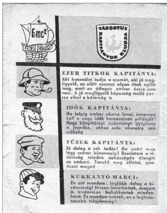
A Kapitányok Klubja tagsági igazolványának előlapja

lajdonságaiknak köszönhetően – szakmájuknak, foglalkozásuknak a mesterei, s akik arra ösztönzik az olvasókat, hogy ők is legyenek mesterei, „kapitányai” a saját hivatásuknak, a diák legyen példaképe minden diáknak, a műszerész minden műszerésznek.