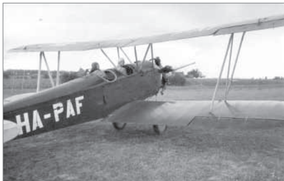
X Kapitány ezen a repülőgépen érkezett

Felejthetetlen élmény volt az 1959-es ráckevei és az 1960-as dunaföldvári táborozás a Duna partján, ahol a Kapitányok Klubjából 70–80 gyerek vett részt. Ráckevére HÉV-vel mentünk, s azt játszottuk, hogy aki az ablakból megpillantja az első macskát vagy tehenet, Macskanyelv vagy Boci csoki jutalmat kap. Megérkezésünkkor őrsökre oszlottunk, és térképvizslat alapján magunknak kellett megtalálnunk az utat a táborhelyre. Dunaföldvárra vízbusszal mentünk. Játékos feladatunk az volt, találjuk el, hogy tíz megadott mesefigura közül melyiknek a nevét viseli majd a hajónk.