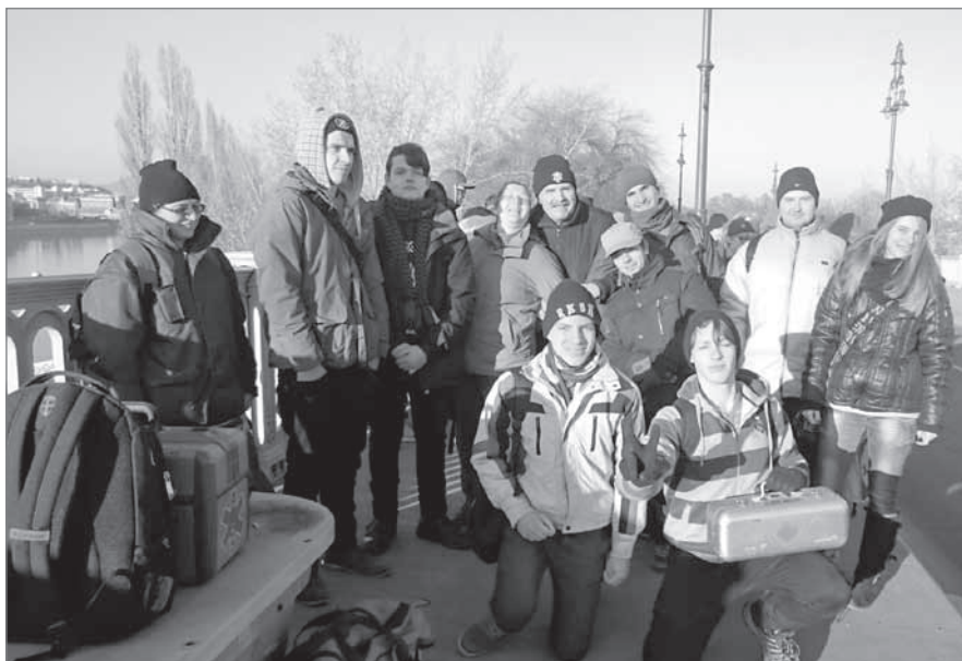
Az IFELORE önkéntesei az Ötpróba Rióba margitszigeti rendezvényén

Vannak újabb céljaink és lelkes fiataljaink!